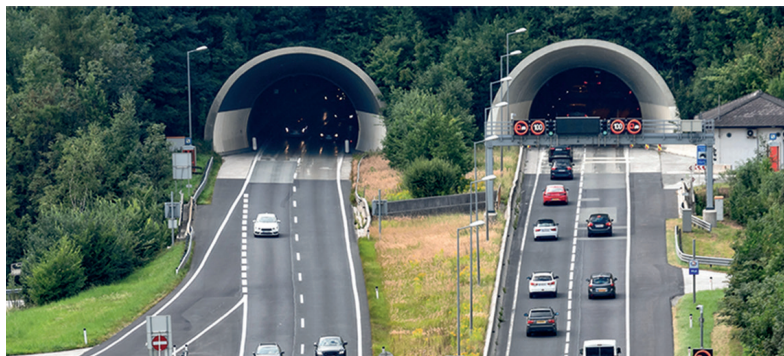
Tauernautobahn: Während der Tunnel-Sanierung kam ein mobiles Verkehrsmanagement-System mit dem RMCS zum Einsatz.